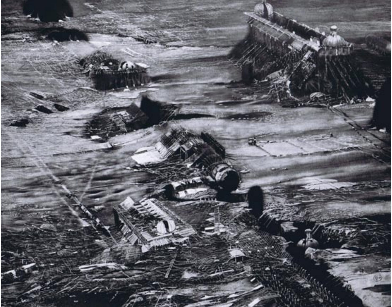
Roj Friberg "postumt landskap"